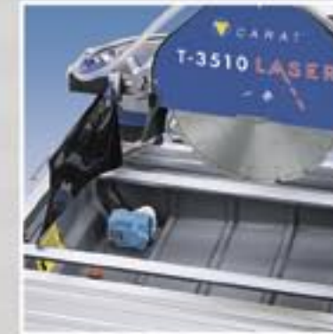
Slagvaste ABS waterbak met pomp.