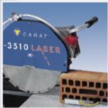
Maximale zaagdiepte van 11 cm.