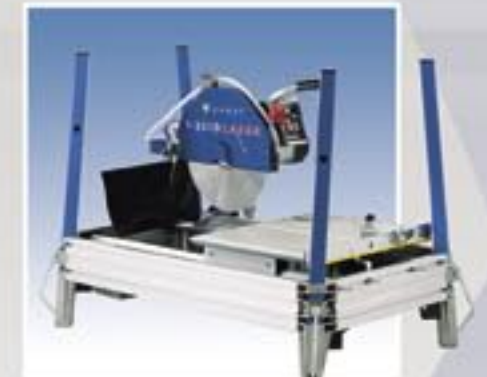
Met de poten ingeschoven kunnen tot 3 machines op elkaar gestapeld worden: enorme ruimtebesparing tijdens transport en opslag.