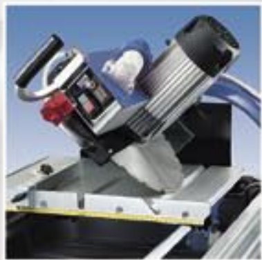
Kantelbare zaagkop voor het zagen onder hoeken van 90° en 45°.