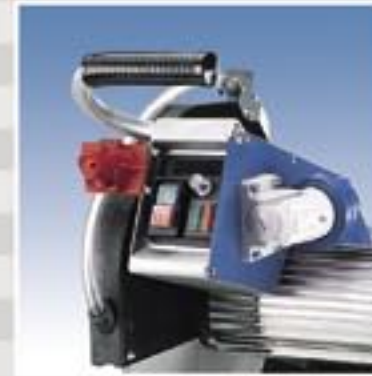
Een krachtige 3Pk-motor met thermische beveiliging.