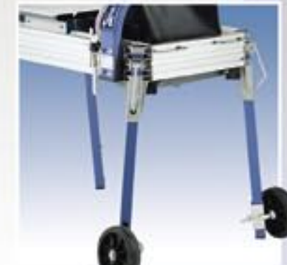
Het wielstel maakt de machine zeer mobiel op de werkvloer. (verkrijgbaar als accessoire)